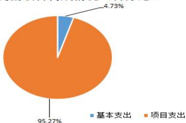
支出项目构成情况（百分比）