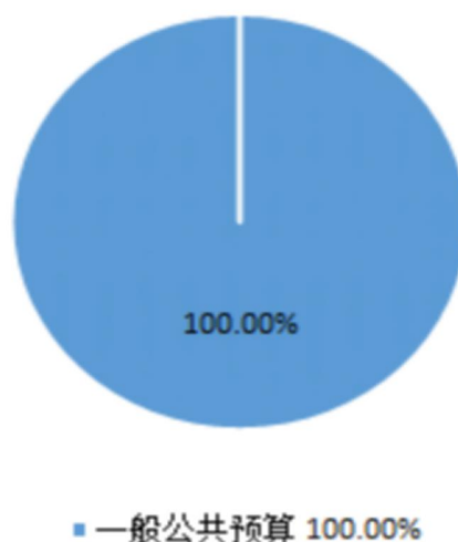
财政拨款收入预算构成情况（百分比）

支出包括：社会保障和就业支出 22.60 万元，占 0.32%；卫生健康支出 15.96 万元，占 0.23%；资源勘探工业信息等支出 7010.77 万元，占 99.45%。