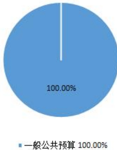
财政拨款收入项目构成情况（百分比）

烟台市大数据局2022年收入预算为7049.33万元，其中：财政拨款7049.33万元，占100%。